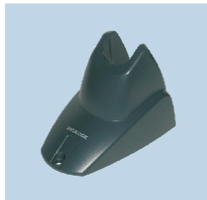
Support mains libres Heron™ avec socle en métal (disponible en option)